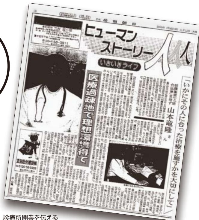
診療所開業を伝える 岳南朝日新聞の記事

標高700メートル。豊かな自然に囲まれた朝霧高原診療所。所内には吹矢やヨガのスペースを併設している。