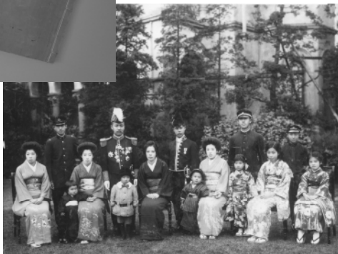
逓信大臣官邸にて→