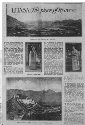
青木のチベット旅行記 “Lhasa, Place of Heaven”

20世紀初頭、浄土真宗本願寺派法主大谷光瑞によってチベットに派遣され、首都ラサに3年間留学し、『西藏遊記』『西藏全誌』など貴重な資料を残した青木文教の人間像を描いた本格的評伝