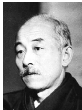
阪谷芳郎(さかたによしろう) (1863-1941) 大蔵省主計主計局長、大蔵次官、西園寺内閣の大蔵大臣。東京市長。貴族院議員。専修大学二代目学長、初代総長。子爵。

A 5判上製本 612頁 定価(本体 11,500円+税) ISBN978-4-8295-0606-6