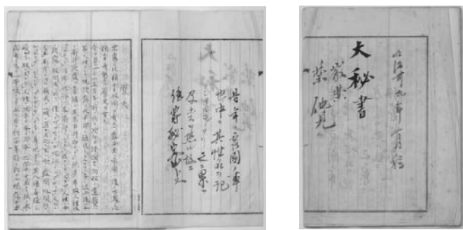
明石元二郎『大秘書（『落花流水』原稿）』