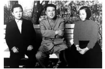
キム・ジョンイルとキム・イルソン