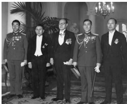
1941年ハンガリー王宮にて。信任状捧呈式に臨む大久保(中央)。

鹿児島出身の外交官。日ソ中立条約、日独伊三国同盟の条約案起草に関わる。1941年ハンガリー駐在特命全權公使。帰国後、外務省軽井沢事務所長。戦後、アルゼンチン大使。