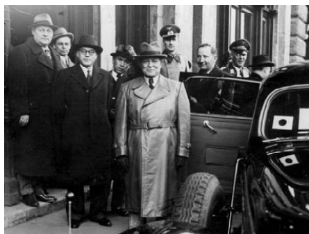
1942年ハンガリーを訪れた大島駐独大使(中央)。左端が大久保。